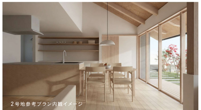
2号地参考プラン内観イメージ