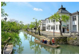
倉敷美観地区まで 徒歩 7分

□物件概要●所在地/倉敷市白楽町672-3●地目/宅地●都市計画/市街化区域●用途地域/第二種住居地域●建ぺい率/60%●容積率/200%●接道/東側3.2m(接面6.5m)●設備/都市ガス、電気、上水道、下水道●備考/建築条件付き、宅地造成等工事規制区域●学区/老松小学校、倉敷市立西中学校●取引態様/販売代理