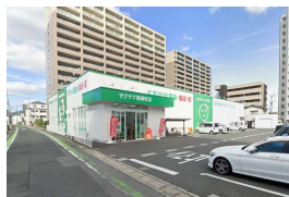
ザグザグ 稲荷町店まで 徒歩 5分