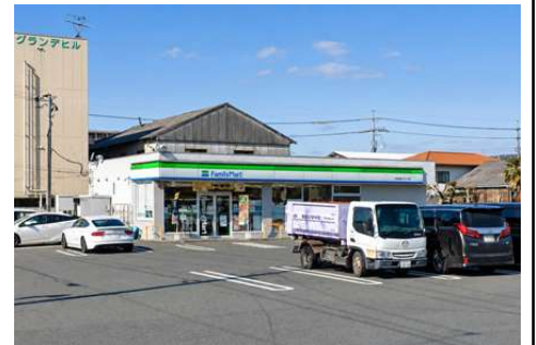
ファミリーマート 総合流通センター北店 徒歩4分