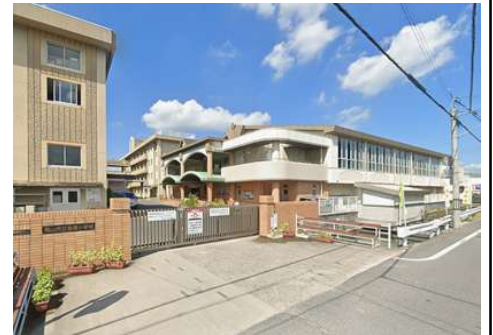
吉備小学校 徒歩22分