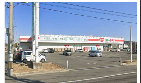
くすりのレディ撫川店 徒歩7分