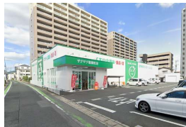
ザグザグ 稲荷町店まで 徒歩 5分