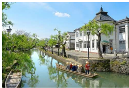
倉敷美観地区まで 徒歩 7分

□物件概要●所在地/倉敷市白楽町672-3●地目/宅地●都市計画/市街化区域●用途地域/第二種住居地域●建ぺい率/60%●容積率/200%●接道/東側3.2m(接面6.5m)●設備/都市ガス、電気、上水道、下水道●備考/建築条件付き、宅地造成等工事規制区域●学区/老松小学校、倉敷市立西中学校●取引態様/販売代理