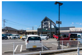
天満屋ハピーズ老松店まで 徒歩 6分