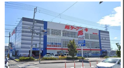
ケーズデンキ岡山大安寺店 徒歩15分