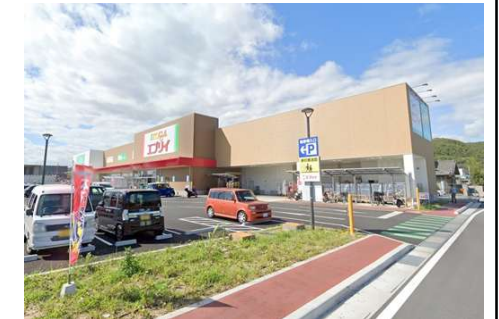
エブリー大安寺店 徒歩13分