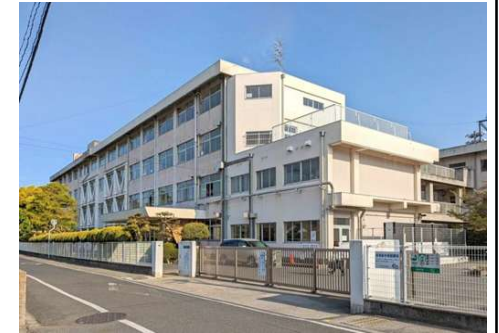
大野小学校 徒歩10分