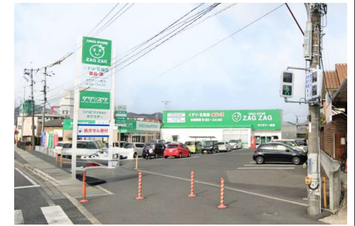
ザグザグー宮店 徒歩10分