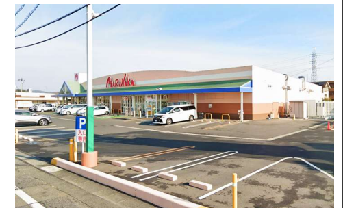
マルナカー宮店 徒歩14分