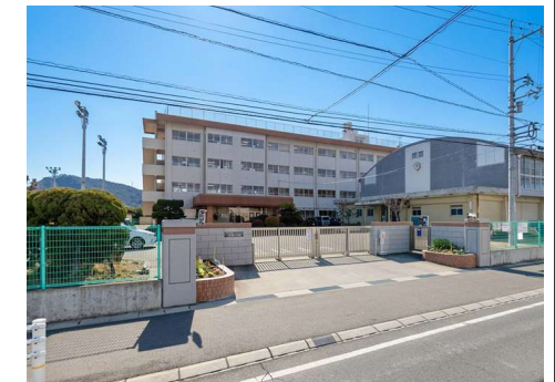
平津小学校 徒歩15分