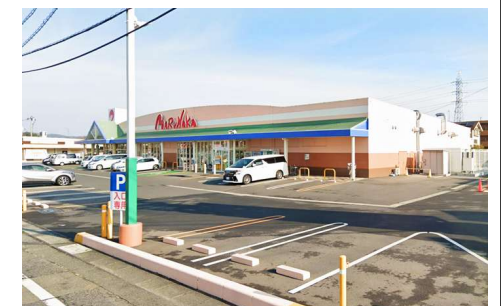
マルナカー宮店 徒歩14分