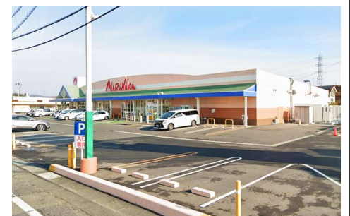
マルナカー宮店 徒歩14分