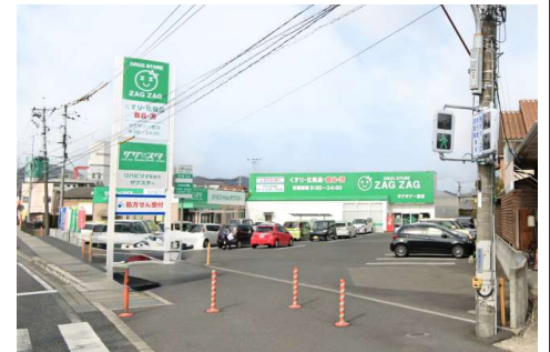
ザグザグー宮店 徒歩10分