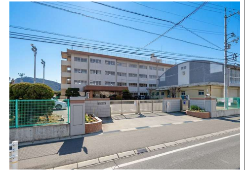
平津小学校 徒歩15分