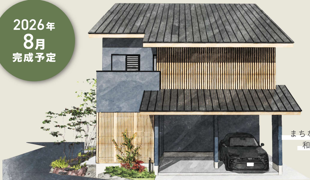
まちなみに馴染む 和モダンな外観