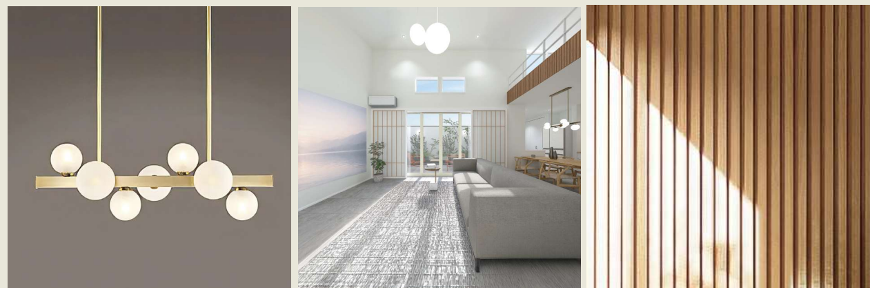
※画像はイメージです。実際の建物とは一部異なります。

外壁の一部に木材を採用しています。年月とともに渋みや深みを増す経年変化がございますので、あらかじめご了承ください。