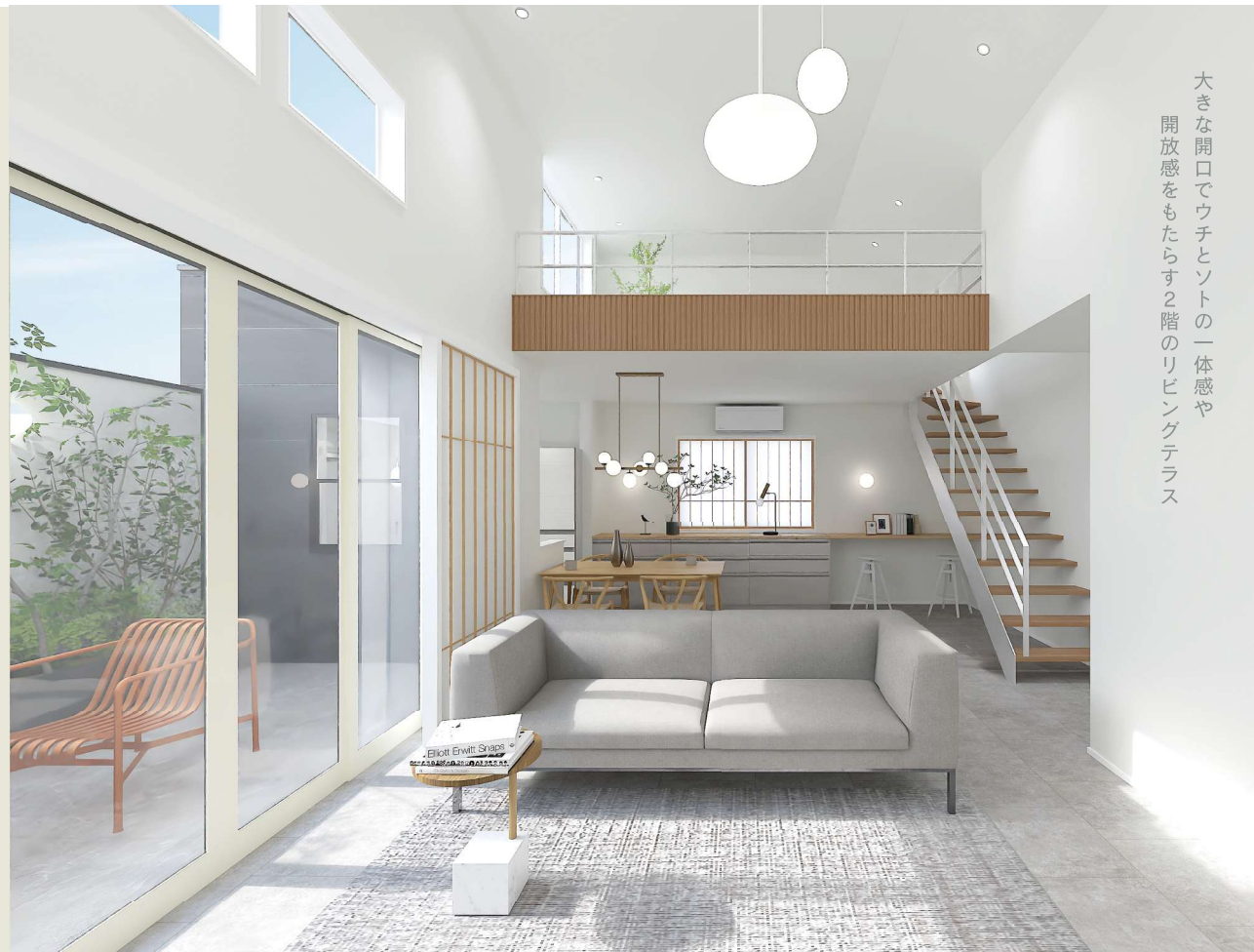
大きな開口でウチとソトの一体感や 開放感をもたらす2階のリビングテラス