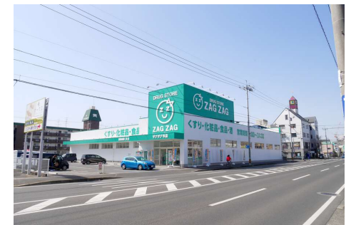
ザグザグ今店 徒歩7分

※この土地は土地売買契約締結後3か月以内に当社と住宅建築請負契約を締結することを条件に販売します。この期間に建築請負契約が成立しない場合は、土地売買契約は白紙となり受領した手付金等の金銭は全てお返しします。