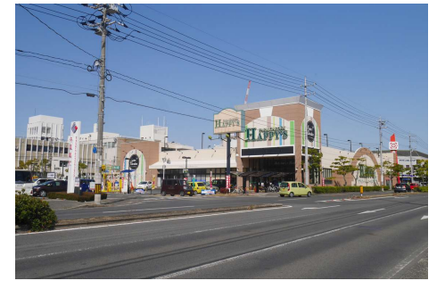
ハピーズ卸センター店 徒歩4分