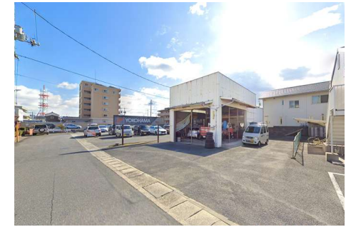
現地写真（解体更地渡し）