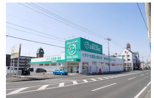
ザグザグ今店 徒歩7分