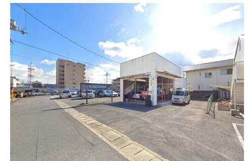
現地写真（解体更地渡し）

※この土地は土地売買契約締結後3か月以内に当社と住宅建築請負契約を締結することを条件に販売します。この期間に建築請負契約が成立しない場合は、土地売買契約は白紙となり受領した手付金等の金銭は全てお返しします。