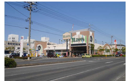
ハピーズ卸センター店 徒歩4分