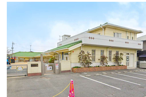
ふたばこども園 徒歩4分