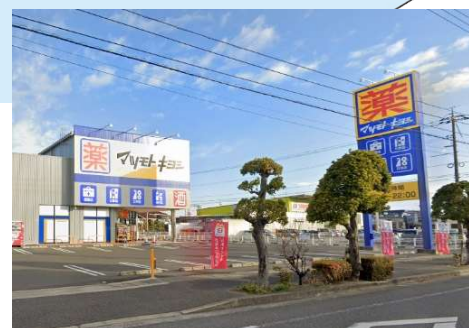
マツモトキヨシ岡山平田店 徒歩10分