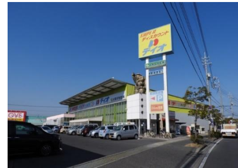
ディオ岡山西店 徒歩10分