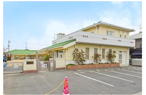
ふたばこども園 徒歩4分