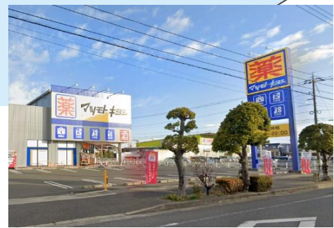
マツモトキヨシ岡山平田店 徒歩10分