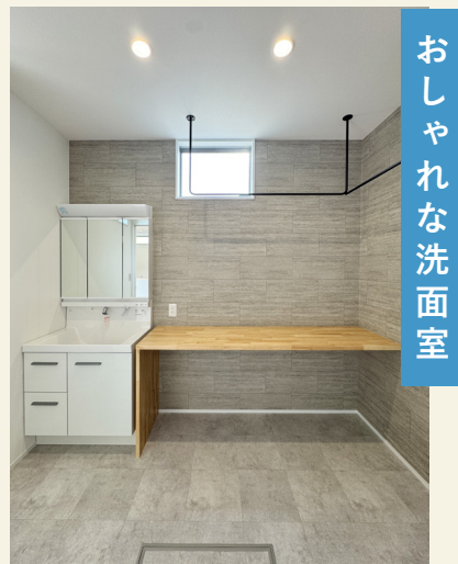
おしゃれな洗面室