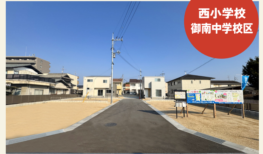
西小学校 御南中学校区