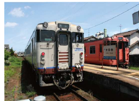
JR吉備線大安寺駅 徒歩2分