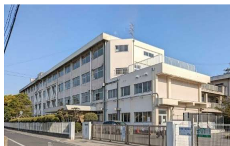
大野小学校 徒歩5分