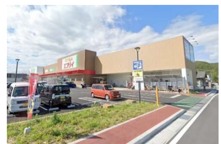
エブリイ岡山大安寺店 徒歩8分

※現在地目は「宅地、畑」ですが、お引渡しまでに「宅地または公衆用道路」に変更します。