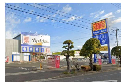
マツモトキヨシ平田店 徒歩5分