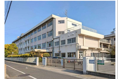
大野小学校 徒歩9分