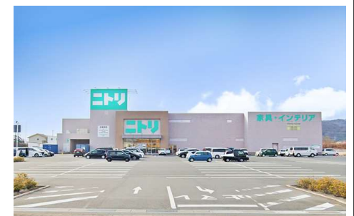
ニトリ大安寺店 徒歩9分