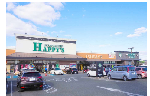
ハピーズ大安寺店 徒歩7分