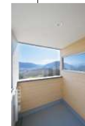
屋根付きのバルコニー