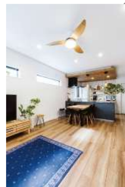
リビングまで見渡せる対面キッチン