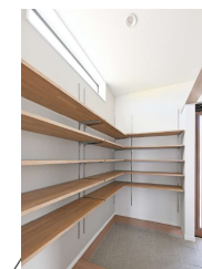
シューズクローゼット