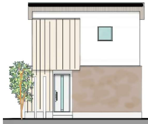
外観イメージパース