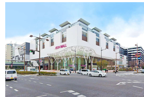
イオンモール岡山 徒歩20分