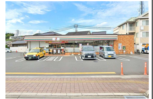
セブンイレブン岡山三門東町店 徒歩3分