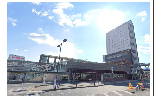
岡山駅 西口 徒歩16分