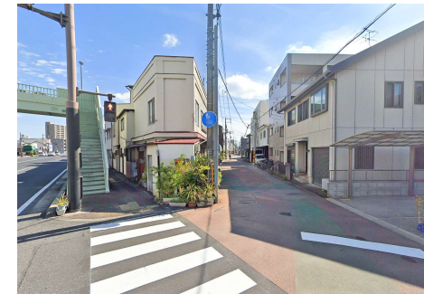
奉還町商店街 西口 徒歩5分