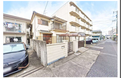
現地写真(解体更地渡し)