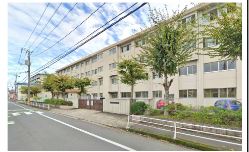
三門小学校 徒歩7分