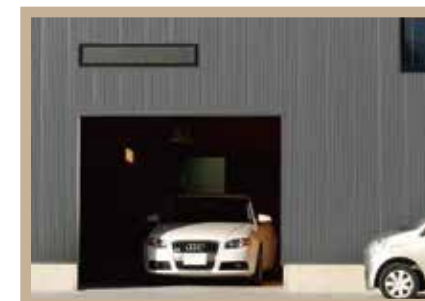
1Fに充実収納のビルトインガレージ