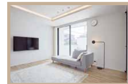
光を取り込んだ明るい空間の2LDK