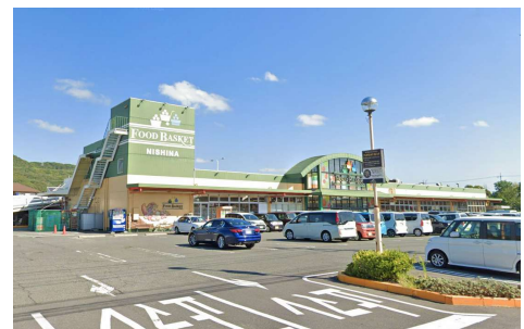
ニシナフードバスケット 西大寺店 徒歩5分