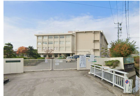
芥子山小学校 徒歩9分