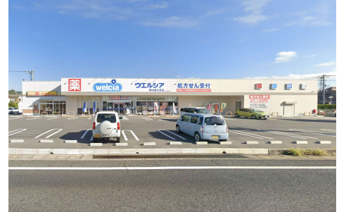
ウエルシア岡山富士見店 徒歩2分