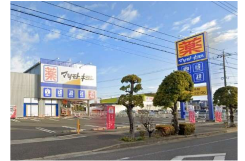
マツモトキヨシ平田店 徒歩5分