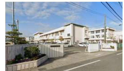
御南中学校 徒歩17分