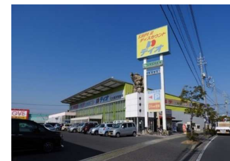
ディオ岡山西店 徒歩5分