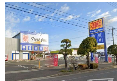
マツモトキヨシ平田店 徒歩5分