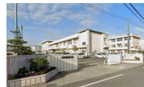
御南中学校 徒歩17分