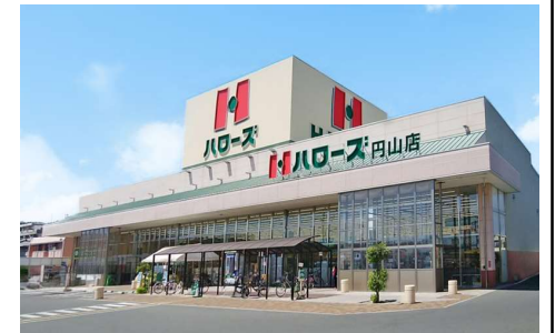
ハローズ円山店 徒歩8分