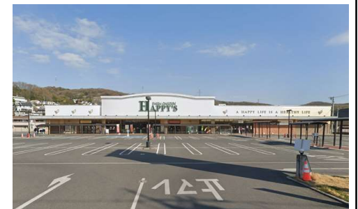
ハピーズ円山店 徒歩12分