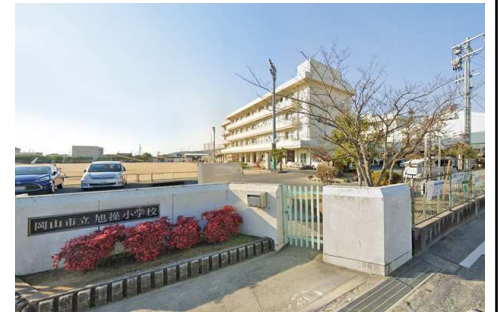
旭操小学校 徒歩9分