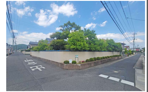
現地写真(解体更地渡し) 2024年11月末解体予定