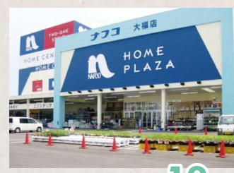
ナフコ 大福店まで 徒歩 13 分

□物件概要●所在地/岡山市南区大福1223番105●地目/宅地●用途地域/第二種中高層住居専用地域●都市計画/市街化区域●建ぺい率/60%●容積率/200%●設備/上水道、下水道、電気、プロパンガス●接道/西側6m●現況/上物あり(解体更地渡し)●引渡し/相談●学区/福田小学校、福田中学校●備考/建築条件付き、建築基準法第22条地域、屋外広告物第3種許可地域●取引態様/仲介(専任媒介)