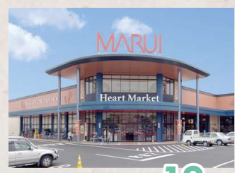
マルイ 大福店まで 徒歩 12 分