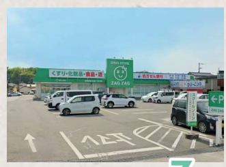
ザグザグ妹尾店まで 徒歩 7 分