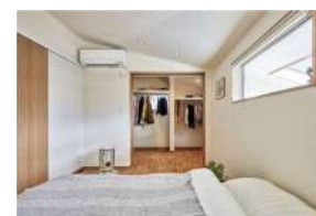
ウォークインクローゼットを完備& 勾配天井の主寝室