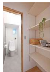
たっぷり収納できる水廻り