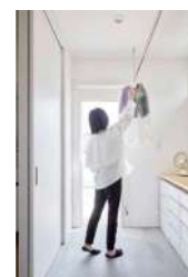
室内干しスペースのある洗面脱衣室