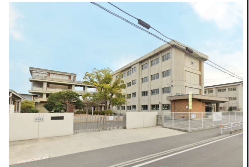
平井小学校 徒歩24分