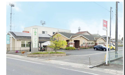
森末泌尿器科・内科 クリニック 徒歩15分