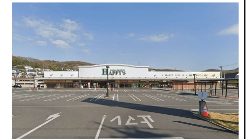
天満屋ハッピーズ円山店 徒歩22分