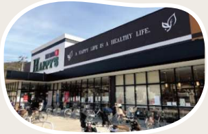
天満屋ハッピーズ津島店 まで 徒歩 16分