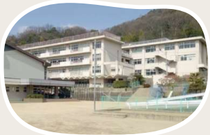
津島小学校 まで 徒歩 18分