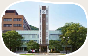
岡山大学 (津島キャンパス) まで 徒歩 3分