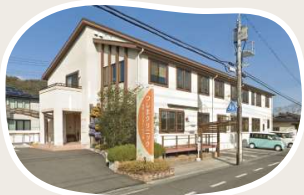
つしまクリニック まで 徒歩 14分