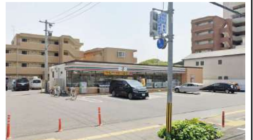
セブンイレブン岡山法界院店 徒歩10分