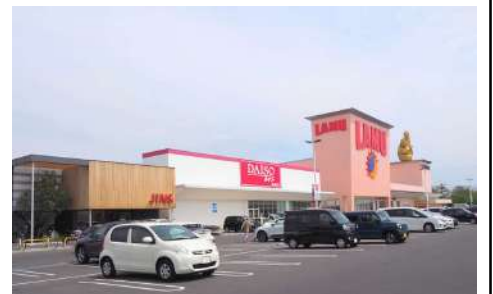
ラ・ムー岡山中央店 徒歩18分