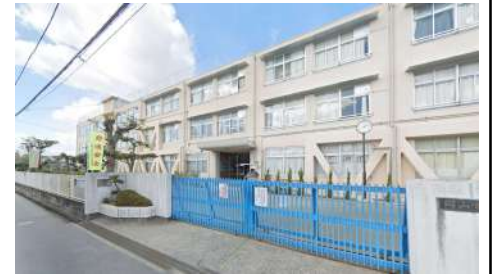
御野小学校 徒歩17分