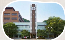
岡山大学 (津島キャンパス) まで徒歩 3分