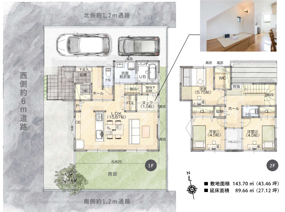
リビングの一角に1.5帖のヌック