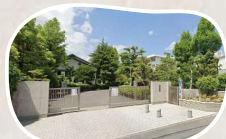
岡北中学校 まで徒歩 7分