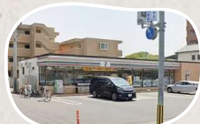
セブンイレブン 岡山法界院店 まで徒歩 10分

□物件概要●所在地/岡山市北区津島東3丁目2645-114●地目/宅地●用途地域/第一種低層住居専用地域●都市計画/市街化区域●建ぺい率/50%●容積率/100%●設備/上水道、下水道、電気、都市ガス●接道/西側約2.3m、南側約1.2m、北側約1.2m、南北道路(通路)は建築基準法非該当●引渡し/相談●学区/御野小学校、岡北中学校●備考/土砂災害警戒区域(急傾斜)、埋蔵文化財包蔵地(朝寝鼻貝塚)、宅地造成工事規制区域●取引態様/仲介(専任媒介)