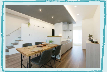
撮影会場は、岡山市南区米倉に 完成したばかりのモデルハウス内。 撮影後にお家の見学もできます。

右記ご予約フォームまたはお電話（086-363-0070） にて9:00-18:00間でご都合の良い時間にご予約下さい。 各時間ごとの定員がございます（先着順）。