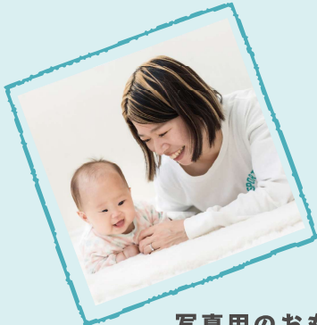
写真用のおもちゃなどの持参可能