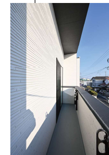
南面のバルコニー