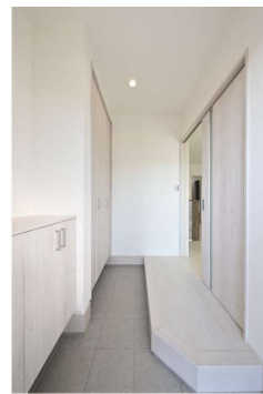
すっきりとした白で統一した縦長の玄関。カウンタータイプの下足入れと天井までの玄関収納を備えました。