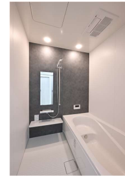
水廻りもモノトーンでシンプルにコーディネート。