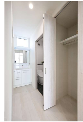
1階ホールにはコードなどを掛けておけるクローゼット。