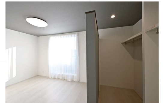
寝室にはウォークインクローゼットを完備しています。