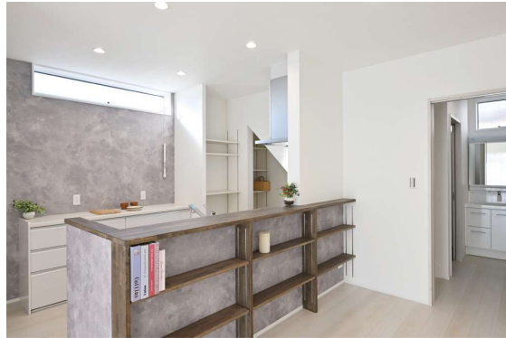
階段下を利用したパントリーやカウンターの可動棚をはじめとするたっぷり収納のキッチン廻り。