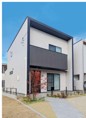
キューブ型のシンプルモダンな外觀に、シンボルツリーや緑化駐車場の緑が調和しています。