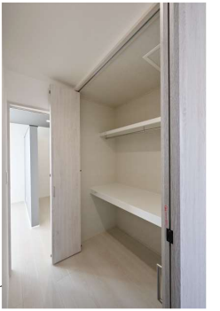
2階ホールの物入れには布団なども収納できます。