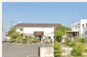
axcis nalf 徒歩2分