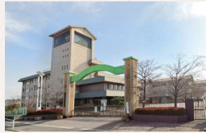
御南小学校 徒歩11分