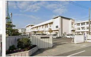
御南中学校 徒歩5分