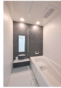
水廻りもモノトーンでシンプルにコーディネート。