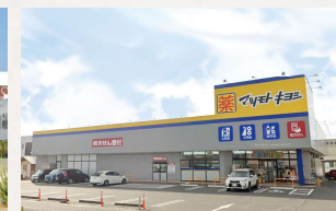
マツモトキヨシ田中店 徒歩3分