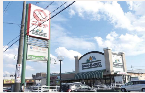
ニシナフルーツバスケット 中仙道店 徒歩10分