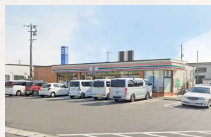
セブンイレブン岡山田中店 徒歩2分