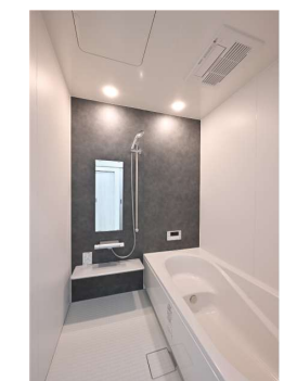
水廻りもモノトーンでシンプルにコーディネート。