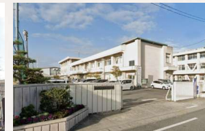
御南中学校 徒歩5分