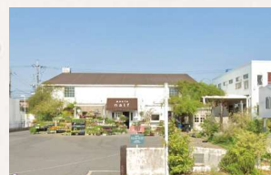
axcis nalf 徒歩2分