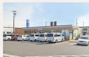
セブンイレブン岡山田中店 徒歩2分