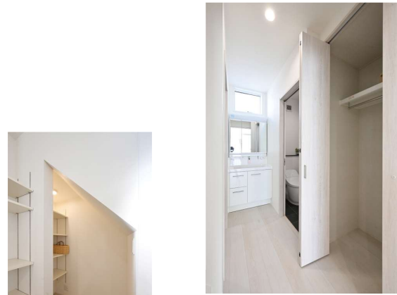
1階ホールにはコードなどを掛けておけるクローゼット。

□物件概要●所在地/岡山市北区田中136-120●構造/木造2階建て●設備/上水道、下水道、電気、都市ガス●接道/南側4m●築年月/2023年11月●建築確認番号/2023岡七確建第000320号●学区/御南小学校、御南中学校●取引態様/売主