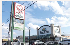
ニシナフルーツバスケット 中仙道店 徒歩10分