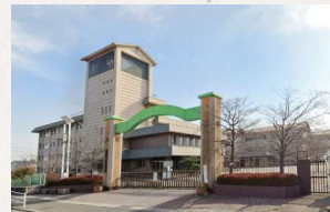
御南小学校 徒歩11分