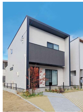
キューブ型のシンプルモダンな外観に、シンボルツリーや緑化駐車場の緑が調和しています。