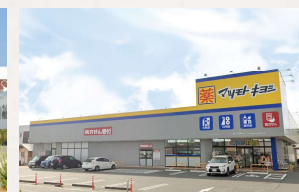
マツモトキヨシ田中店 徒歩3分