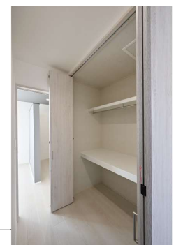
2階ホールの物入れには布団なども収納できます。