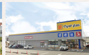
マツモトキヨシ田中店 徒歩3分