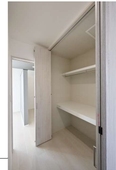
2階ホールの物入れには布団なども収納できます。