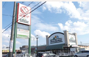
ニシナフルーツバスケット 中仙道店 徒歩10分