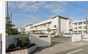
御南中学校 徒歩5分