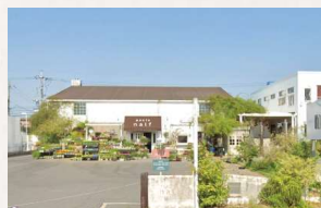
axcis nalf 徒歩2分