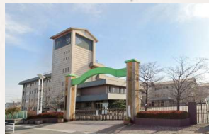
御南小学校 徒歩11分