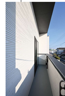
南面のバルコニー