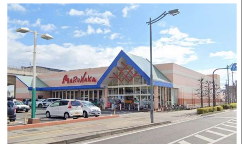
マルナカ大元店 徒歩9分