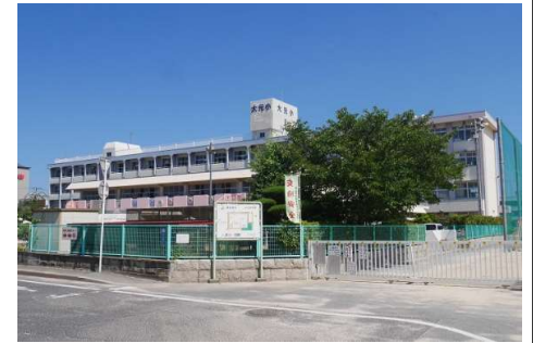
大元小学校 徒歩10分