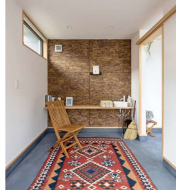
スミモルタルで仕上げた、ウチとソトをつなぐ土間スペース。