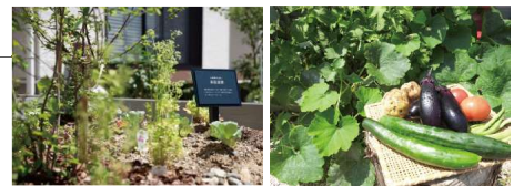
※一部写真はイメージです。

「育てる」ことを家族みんなで体験できる庭。採れたての野菜や果物が食卓に並ぶのは何よりの贅沢かも。