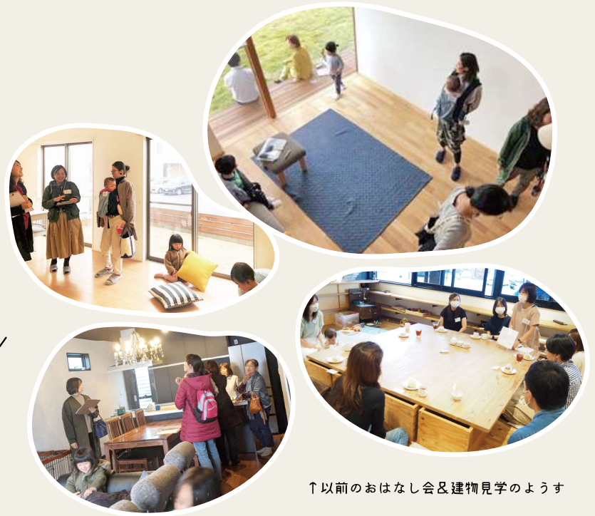
↑以前のおはなし会&建物見学のようす

ハチドリの家をみんなで体感し、 それぞれの理想の住まい方をざっくばらんにお話しませんか？