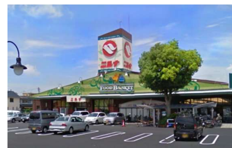
ニシナ三門店 徒歩13分