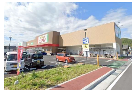
エブリー大安寺店 徒歩14分