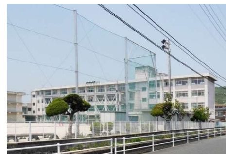
大野小学校 徒歩12分