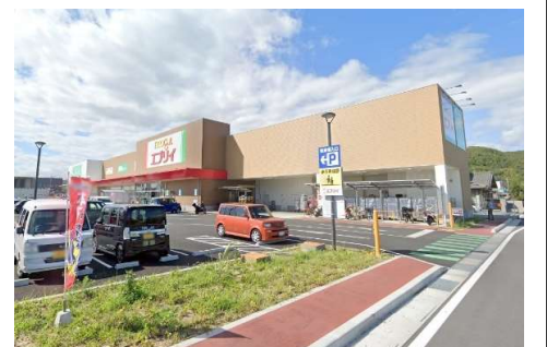
エブリー大安寺店 徒歩14分