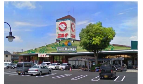
ニシナ三門店 徒歩13分