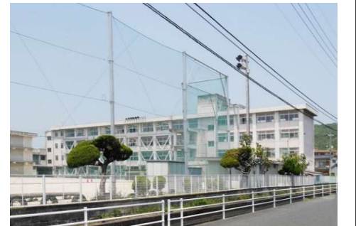
大野小学校 徒歩12分