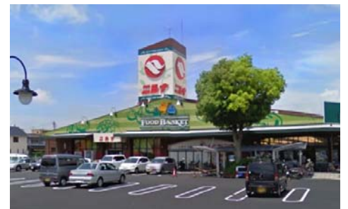
ニシナ三門店 徒歩13分