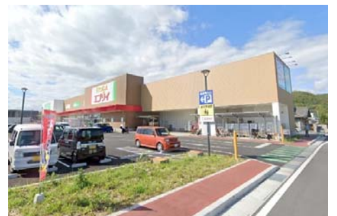
エブリー大安寺店 徒歩14分