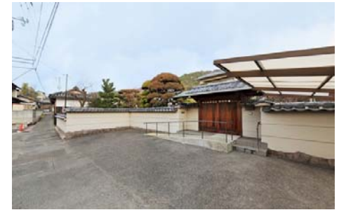
現地写真(解体更地渡し)