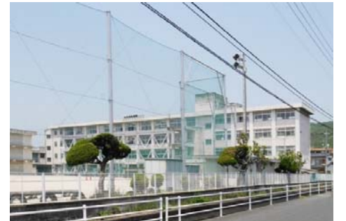
大野小学校 徒歩12分