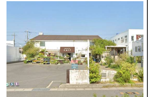
axcis half 徒歩2分