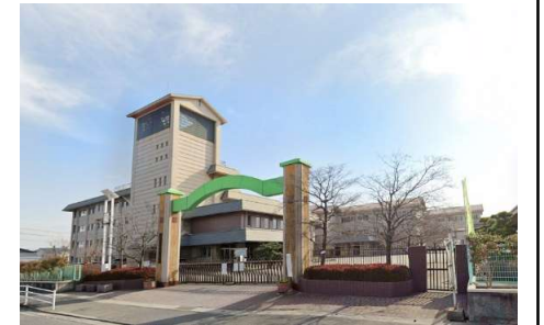
御南小学校 徒歩11分