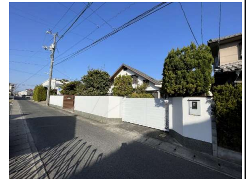
現地写真(解体更地渡し)