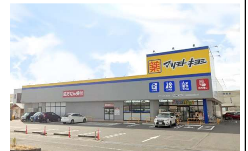
マツモトキヨシ田中店 徒歩3分