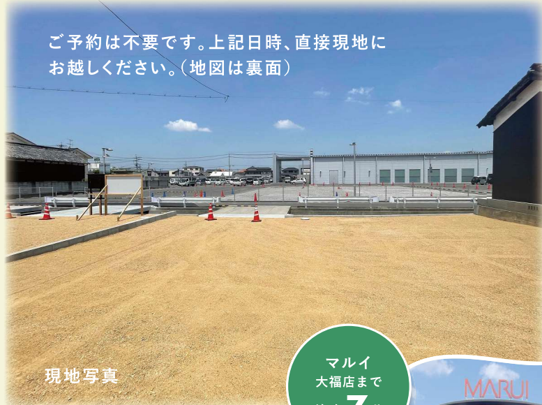
ご予約は不要です。上記日時、直接現地にお越しください。(地図は裏面)