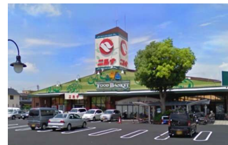
ニシナ三門店 徒歩8分