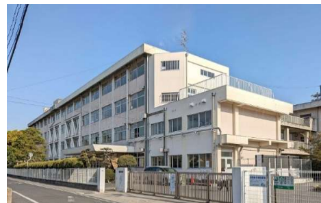
大野小学校 徒歩11分