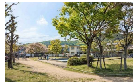
大安寺東町公園 徒歩1分