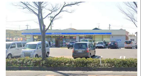
ローソン岡山長利店 徒歩6分