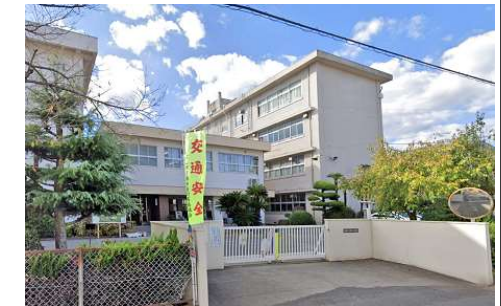
財田小学校 徒歩18分