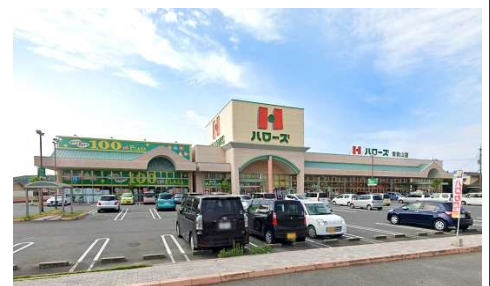
ハローズ東岡山店 徒歩16分