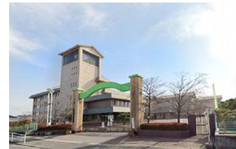
御南小学校 徒歩11分