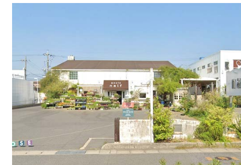
axcis half 徒歩2分