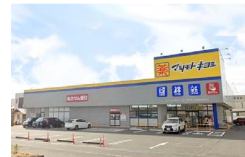
マツモトキヨシ田中店 徒歩3分