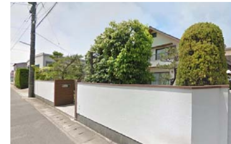
現地写真(解体更地渡し)