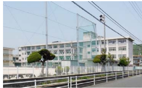
大野小学校 徒歩11分