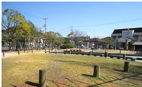
大安寺東町公園 徒歩1分