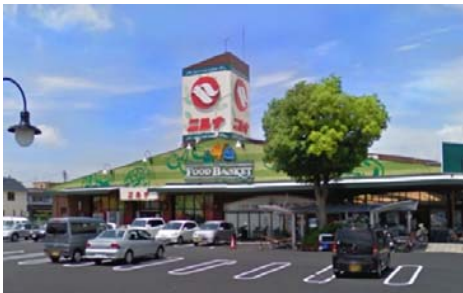
ニシナ三門店 徒歩8分