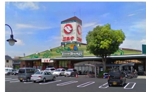
ニシナ三門店 徒歩8分