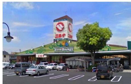
ニシナ三門店 徒歩8分