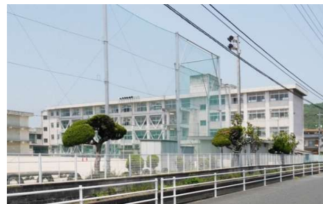
大野小学校 徒歩11分