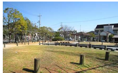
大安寺東町公園 徒歩1分