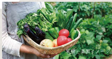
1㎡以上の家庭菜園を設ける(プランター植え可)