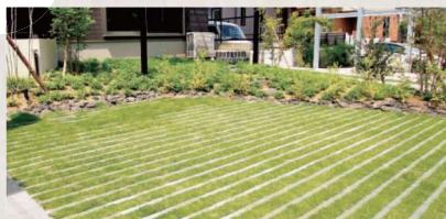
グリーンゾーン 900mm (ガラスハイブリックボーダー+芝生)