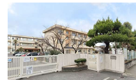
伊島小学校 徒歩7分