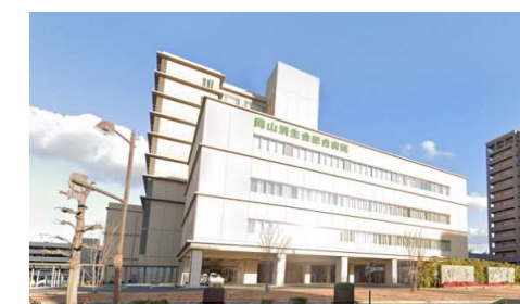
岡山済生会総合病院 徒歩11分